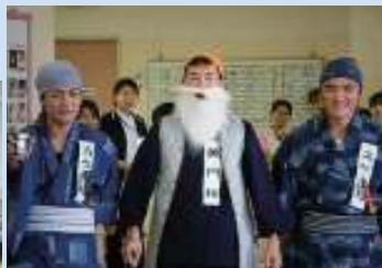
▲黄門様と助さん・格さん